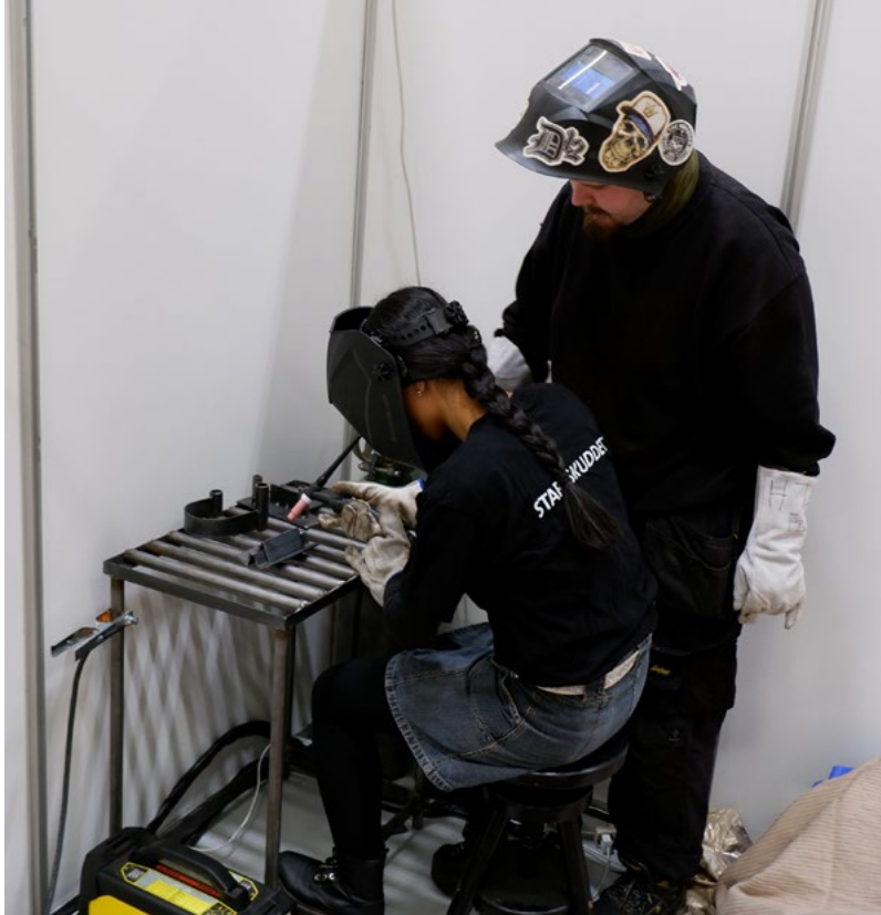
Thue underviser andre unge i, hvordan man svejser.